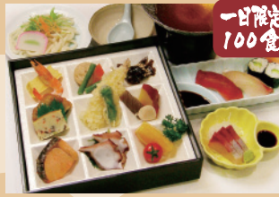
盛り合わせ寿司膳 2,100円