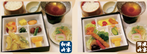
修学旅行お子様用ランチ 1,260円